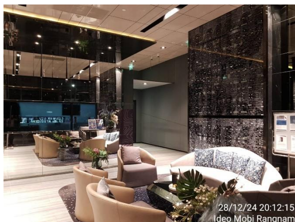
รูปที่ 1.4-1 แสดงสถานภาพปัจจุบันของโครงการ (ช่วงเดือนกรกฎาคม - ธันวาคม 2567)